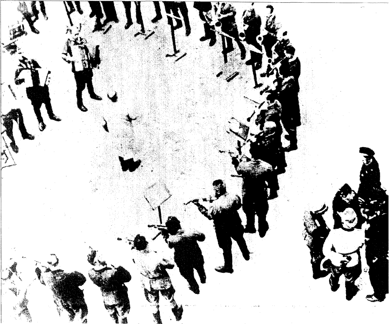
• Het concentratiekamp Auschwitz telde verschillende orkesten om de kampleiding te vermaken, maar ook om executies te begeleiden